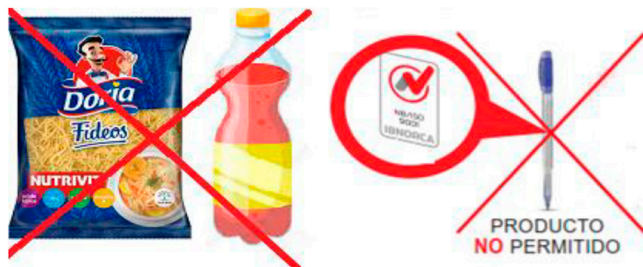
(x) Usos incorrectos

Sin embargo, la organización puede reproducir el siguiente texto en su envase primario: “La empresa con Sistema ... (nombre del sistema) ... certificado por IBNORCA ha diseñado y fabricado este producto” . Siempre que el producto se encuentre dentro del alcance del sistema certificado, antes de incluir la marca, deberá solicitar la aprobación del IBNORCA.