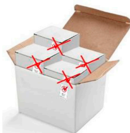
Uso correcto en el envase secundario (x) Uso incorrecto en envases primarios

La marca IBNORCA, en ningún caso, puede reproducirse directamente sobre los productos o sobre el embalaje primario de los mismos. (Se entiende por embalaje primario, aquel que contiene la unidad de venta), o de ninguna manera que pueda interpretarse que denota la conformidad del producto.