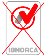
(x)Uso incorrecto "No indica la norma de certificación"

En caso de que se disponga dos o más certificaciones integradas, por ejemplo, ISO 9001 + ISO 14001, y el alcance sea idéntico en los sistemas, se puede optar por utilizar un logotipo versión vertical por norma o un logotipo versión horizontal donde se plasme las normas certificadas.