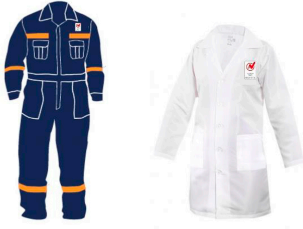
Usos correctos en ropa de trabajo

Es permitido el uso del logo en la ropa de trabajo para dotación del personal, siempre y cuando el personal se encuentra dentro del alcance.