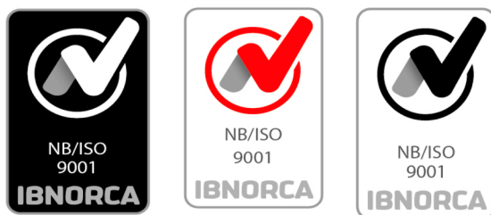
Aplicación de logos correctos

Los colores del Logo IBNORCA se definen en tres tonos diferentes con el fin de que puedan utilizarse en diferentes fondos donde se vaya a imprimir.